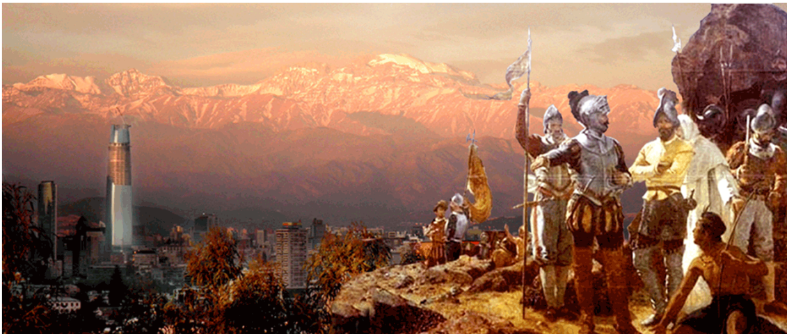
Figura 3: Cuadro de Pedro Lira con fondo actual de Santiago, muestra la altura del edificio Costanera Center ubicado en Providencia, al centro el cerro El plomo, sagrado para Mapuches e Incas.

El ejemplo de Providencia, es una clara señal de la factibilidad de realizar modificaciones al plan regulador municipal sobre las alturas de las edificaciones, pese que en este caso los argumentos fueran distintos a los planteados en este documento, son sumamente coherentes y complementarios, pues las ciudades a escala humana deben propiciar el respeto de los convenios internacionales de Derechos Humanos como lo es el 169 de la OIT 11 .