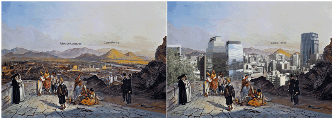
Figura 3. Izquierda: cuadro de Mauricio Rugendas, vista desde el cerro Santa Lucía al poniente. Derecha: la misma vista con la situación actual.

En base a lo anterior, surge la inquietud de preservar las líneas visuales entre los cerros y frente a la postulación del concurso regional de “Cerros Islas”, se propone realizar los cambios necesarios en los planos reguladores comunales de la cuenca de Santiago con el objeto de limitar la altura de los edificios para así preservar la conexión visual entre los cerros.