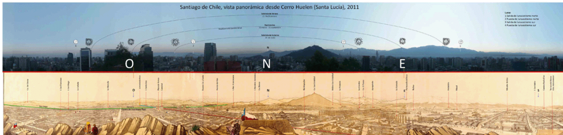
Figura 2: Arriba, panorámica de Santiago actual, muestra edificios tapando e horizonte poniente. Abajo, Vista panorámica de Santiago desde el cerro Santa Lucía, James Melville Gillis, 1855.

por donde salen o se ponen los astros, lo que es denominado por la UNESCO como paisajes culturales de valor patrimonial (Rössler, 2000) 8 .